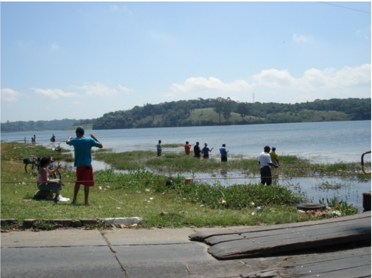
Figura 2: lazer de fim de semana na represa, acesso da primeira balsa ao Bororé (foto 2008).

O objetivo é elaborar no contexto do Plano de Manejo da APA do Bororé-Colônia (Zona Sul de São Paulo), trabalhando na forma de um escritório de projeto envolvendo alunos de graduação, de pós-graduação, colaboradores e docente, o diagnóstico e estratégias de implantação do Parque Itaim ou do Parque Bororé, que serão encaminhadas como contribuição aos gestores públicos, técnicos e entidades envolvidas e publicadas em número especial da revista Cidade sem Nome sob licença livre.